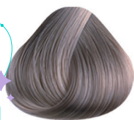
PLATA COOL SILVER