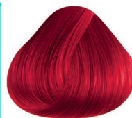
6RI ROJO INTENSO INTENSE RED