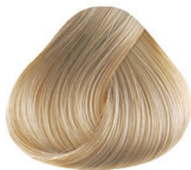
11.11 RUBIO ACLARANTE CENIZO INTENSO PLATINUM BLONDE INTENSE ASH