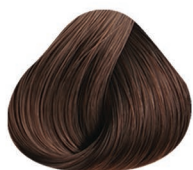
4CC CASTAÑO MEDIO MEDIUM BROWN