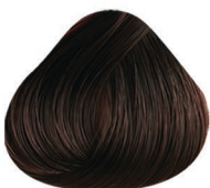
4.10 CASTAÑO MEDIO CENIZO MEDIUM BROWN ASH