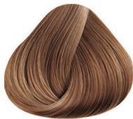
9.10 RUBIO CLARÍSIMO CENIZO VERY LIGHT BLONDE ASH