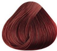
5.65 CASTAÑO CLARO ROJO CAOBA LIGHT BROWN RED MAHOAGANY