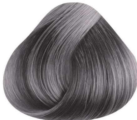
9.91 PLATA SILVER