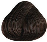
3 CASTAÑO OSCURO DARK BROWN