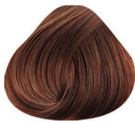
7.35 RUBIO MEDIO DORADO CAOBA MEDIUM BLONDE GOLD MAHOAGANY