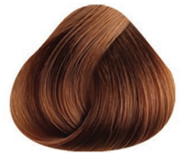
7 RUBIO MEDIO MEDIUM BLONDE