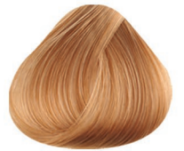
9CC RUBIO CLARÍSIMO VERY LIGHT BLONDE