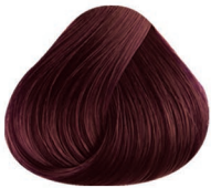
4.26 CASTAÑO MEDIO IRIZADO ROJO MEDIUM BROWN VIOLET RED