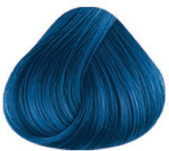
AZUL SHINNING BLUE