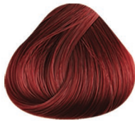
7.62 RUBIO MEDIO ROJO NACARADO MEDIUM BLONDE RED PEARLY