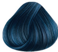
7000 AZUL BLUE