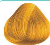
AMARILLO BRIGHT YELLOW