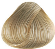
10.21 RUBIO EXTRACLARO NACARADO CENIZO INTENSO LIGHTEST BLONDE INTENSE ASH