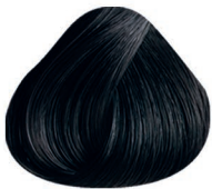
1.70 NEGRO AZUL DARK BLUE