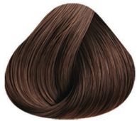
4CC CASTAÑO MEDIO MEDIUM BROWN