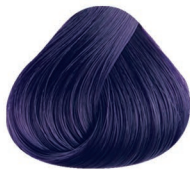
2000 IRIZADO VIOLET