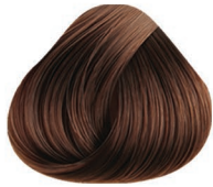
7.32 RUBIO MEDIO DORADO IRIZADO MEDIUM BLONDE GOLD VIOLET