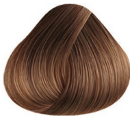
7.10 RUBIO MEDIO CENIZO MEDIUM BLONDE ASH