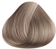
1000 CENIZO ASH