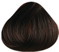
4.10 CASTAÑO MEDIO CENIZO MEDIUM BROWN ASH