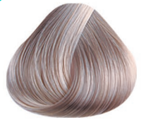
9.22 RUBIO CLARÍSIMO PERLADO VERY LIGHT BLONDE PEARL