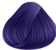
VIOLETA VIVID PURPLE