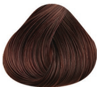
6.35 RUBIO OSCURO DORADO CAOBA DARK BLONDE GOLD MAHOAGANY