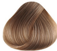
9.01 RUBIO CLARÍSIMO LIGERAMENTE CENIZO VERY LIGHT BLONDE NATURAL ASH