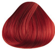
6000 ROJO RED