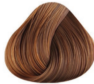
6 RUBIO OSCURO DARK BLONDE