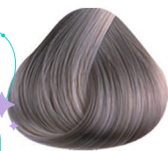
PLATA COOL SILVER