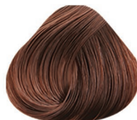
7.13 RUBIO MEDIO CENIZO DORADO MEDIUM BLONDE GOLDEN ASH