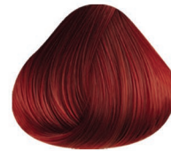
6.66 RUBIO OSCURO ROJO INTENSO DARK BLONDE RED INTENSE