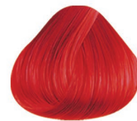
ROJO LOVELY RED