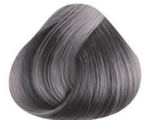
9.91 PLATA SILVER