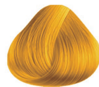
AMARILLO BRIGHT YELLOW