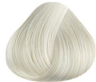
0-RA REFORZADOR HIGH LIFTING REINFORCER