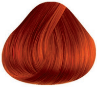
7CI COBRE INTENSO INTENSE COPPER