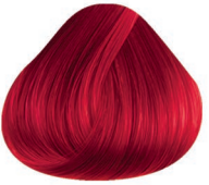
6RI ROJO INTENSO INTENSE RED